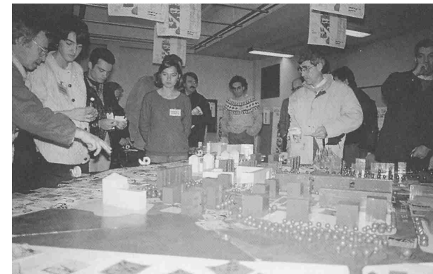
Seminario di studio